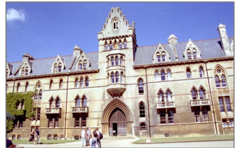
オックスフォード大学を見学する観光客 (2005年8月)