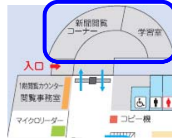
泉キャンパス図書館