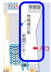
多賀城キャンパス図書館